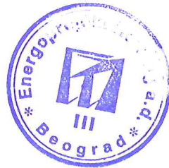
Siniša Tekić, dipl. ek.