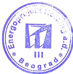
Siniša Tekić, dipl. ek.